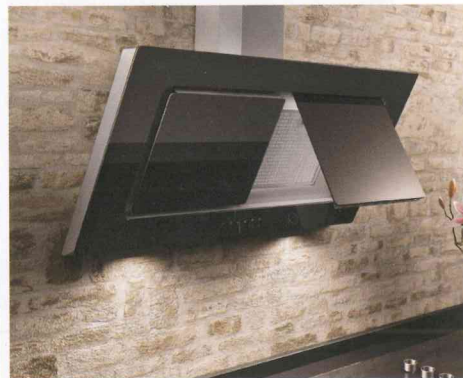
Seit Juni 2010 lieferbar: die neue Ausführung der Aquilo in Weiß und in Schwarz.