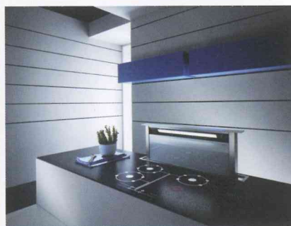
Downdraft-Haube mit Beleuchtung (wahlweise in Edelstahl, Weiß-Glas oder Schwarz-Glas): Adagio.