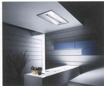
Leuchtet durch das weiße Glas: Cloud Nine.