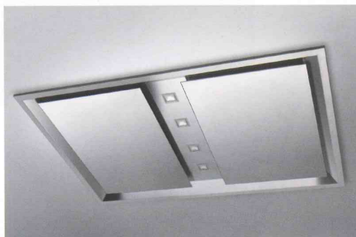
Deckenhaube mit Randabsaugung: Cielo.